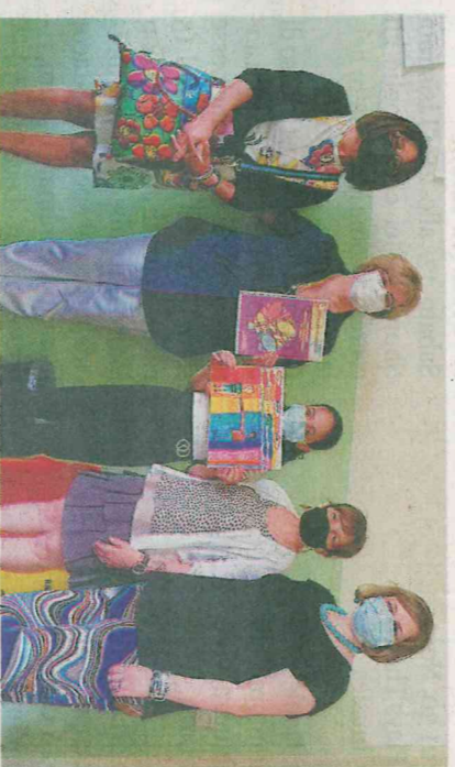
NO DIFFERENZE 1+A SECONDARIA PALETTA; SUL PULLMAN CON I MIEI AMICI ANDIAMO A SCUOLA SEZIONE C INFANZIA MARRATI