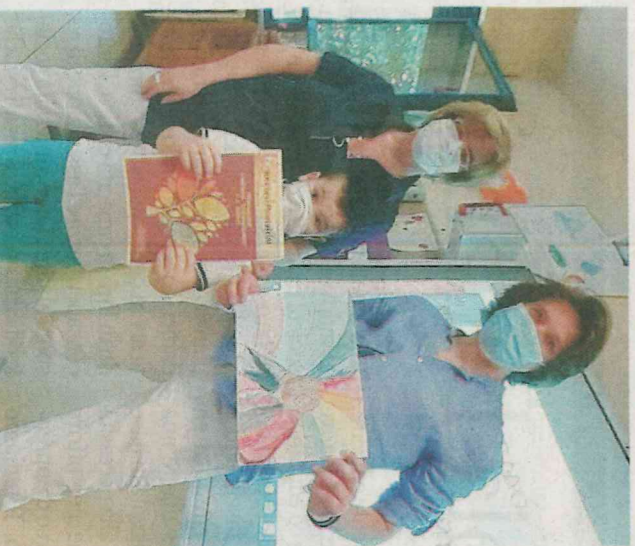
LA FORZA DELL'AMICIZIA 1+B PRIMARIA BUSCAGLIA; IL MONDO NON È BELLO SENZA NESSUN COLORE INFANZIA ELVE FORTIS SEZ. TERRA; ARCOBALENO DI MILLE COLORI SEZ C INFANZIA SABIN